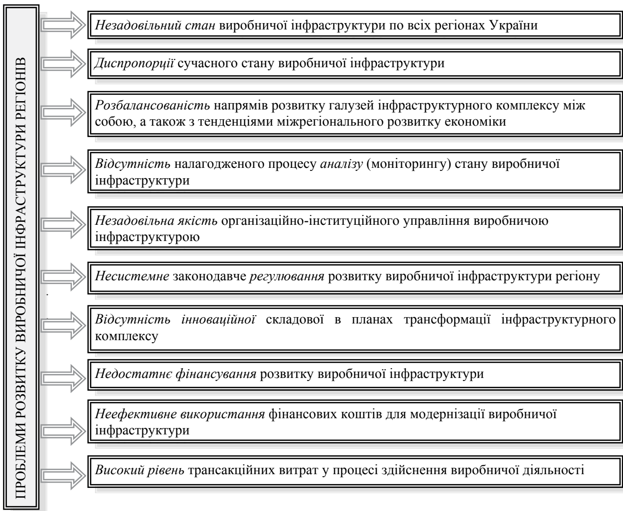
Рис. 1. Основні проблеми розвитку виробничої інфраструктури регіонів

На наступному етапі має бути вирішена найскладніша проблема реформування інфраструктурного комплексу – пошук джерел фінансування. Функціональне навантаження інституцій та інших суб'єктів на ньому різне, хоча всі дії означені в моделі однаковими стрілками ( \rightarrow ).