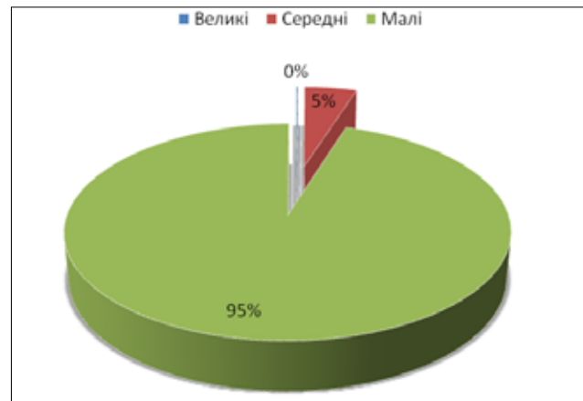
Рис. 1. Кількість підприємств станом на 01.01.2015 р.

За даними Державного комітету статистики України станом на 01.01.2015 в Україні налічувалося 341001 суб'єкт господарювання, з яких 324598 суб'єктів малого підприємництва, а це 95,2% від загальної кількості усіх підприємств. (рис. 1).