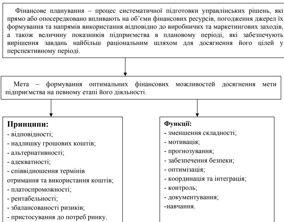
Рис. 2. Узагальнення сутнісних складових елементів фінансового планування діяльності підприємства

– координація та інтеграція – інтеграція і взаємодія різних сфер діяльності підприємства як у процесі планування, так і в процесі реалізації затвердженого плану;