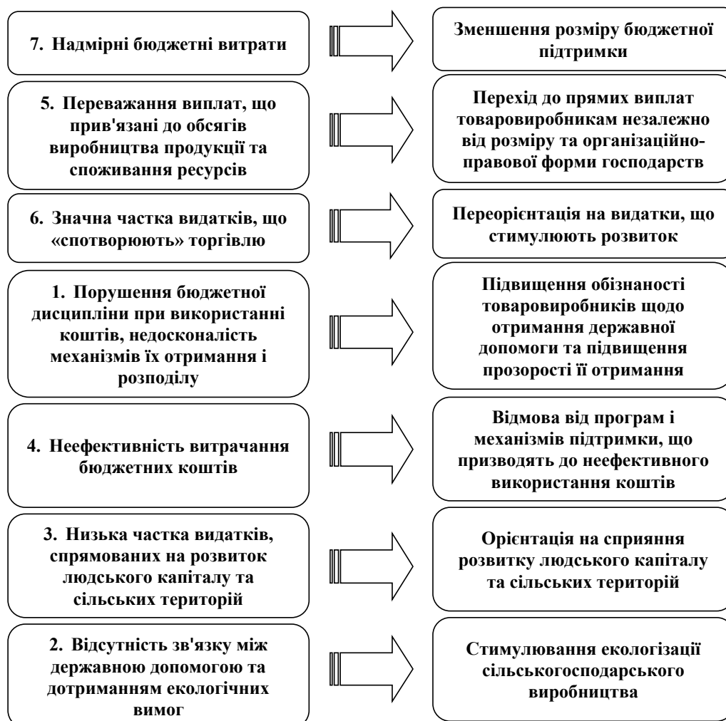
Рис. 2. Напрями трансформації державної бюджетної підтримки аграрного сектору в Україні

В структурі запропонованого Європейською Комісією бюджету САП ЄС на 2012–2020 рр. видатки за фінансовим блоком «Прямі виплати і маркетингові витрати» становлять 72,8% (281,8 млрд євро), за блоком «Сіль-