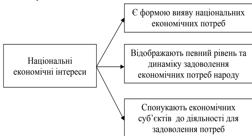
Рис. 1. Взаємозв'язок потреб та інтересів

Об'єктами забезпечення економічної безпеки у загальному розумінні є всі процеси та явища, які певним чином стосуються забезпечення соціально-економічного розвитку. Висо-