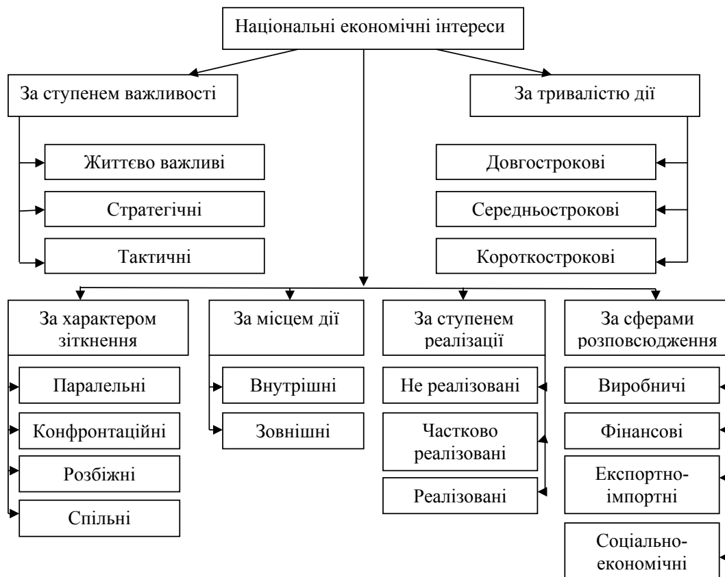
Рис. 2. Класифікація національних економічних інтересів

Державі в національній економіці необхідно максимально чітко визначити систему національних інтересів, на основі якої будуть базуватися її дії. Коло національних інтересів доволі широке. Таким чином, не намагаючись охопити всю систему національних інтересів щодо економічної безпеки, визначимо найбільш пріоритетні національні інтереси, на засадах яких має будуватися та розвиватися