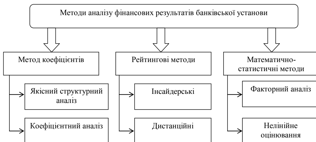
Рис. 1. Класифікація методів аналізу фінансових результатів діяльності банківської установи [1, с. 180]

Перший метод полягає у здійсненні експертної оцінки функціонування банківської установи. У якості експертів можуть виступати акціонери банку, його співробітники чи інші зацікавлені сторони. Результати цього методу досить часто ґрунтуються на інтуїції та досвіді групи експертів, що проводять таку оцінку. Інший метод є повною протилежністю до якісного методу. Так, коефіцієнтний метод ґрунтується на визначенні переліку показників, які будуть покладені в основу оцінки фінансових результатів. Коефіцієнтний метод передбачає проведення великої кількості розрахунків, які визначають ефективність функці-