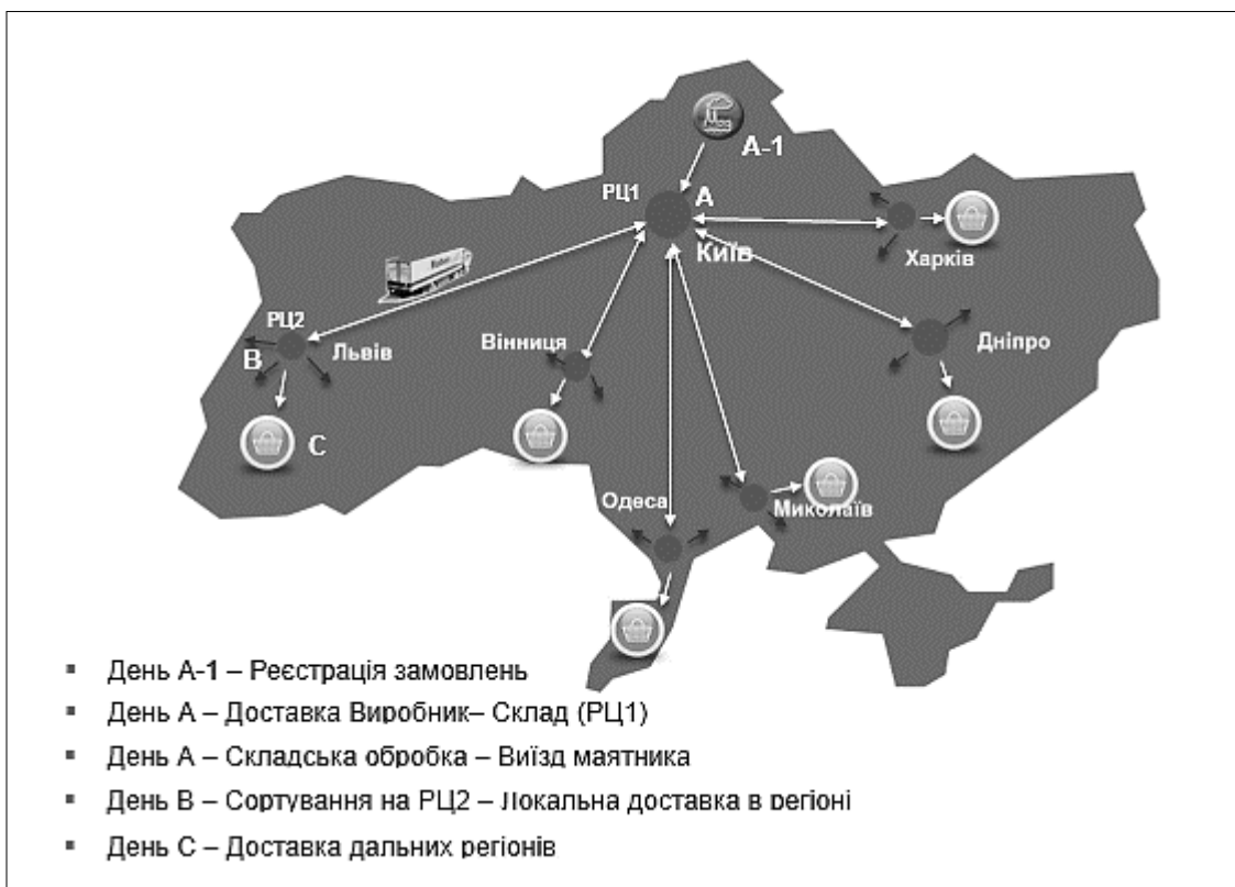
Рис. 3. Схема ланцюга перевезень «фреш-вантажів» філії м. Львів ТОВ «Рабен Україна» у 2018 р.

Основними ризиками під час надання послуги «фреш-логістики» є проблеми під