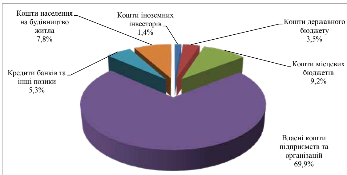
Рис. 4. Розподіл капітальних інвестицій за джерелами фінансування, % у 2017 р. [2]

Висновки з цього дослідження. Інвестиційна діяльність є досить важливою складовою розвитку підприємства та економіки України загалом. Проте сьогодні інвестицій-