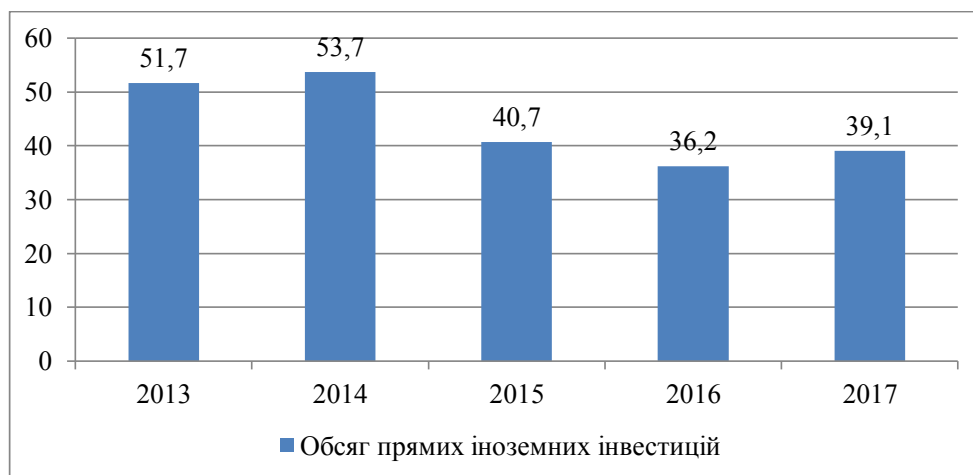
Рис. 1. Обсяг прямих іноземних інвестицій в Україні протягом 2013–2017 рр., млрд. дол. США [2]