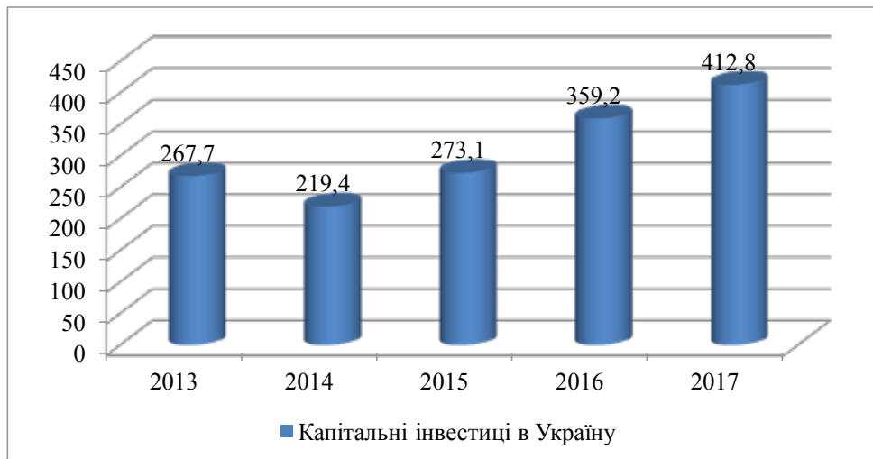
Рис. 2. Капітальні інвестиції в Україні протягом 2013–2017 рр., млрд. дол. США [2]