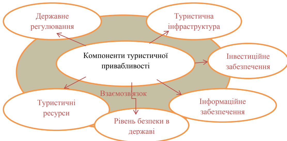
Рис. 1. Компоненти туристичної привабливості Одеського регіону

Як ми бачимо на рис. 1, всі компоненти туристичної привабливості пов'язані між