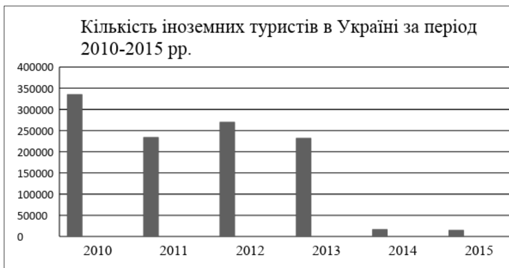
Рис. 3. Кількість іноземних туристів України за період 2010-2015 років

Джерело: розроблено автором за даними Держкомстату http://www.ukrstat.gov.ua/