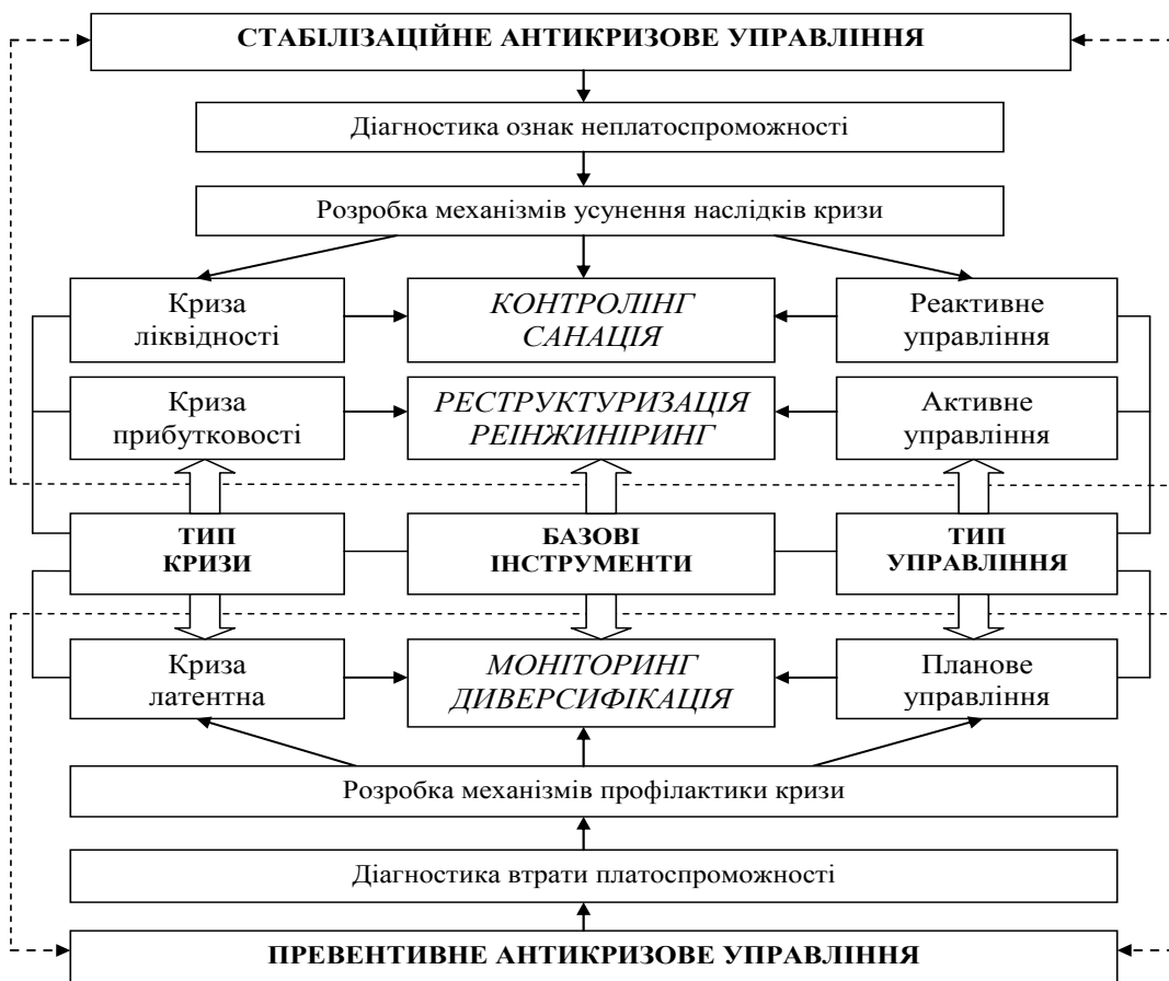
Рис. 2. Стабілізаційне та превентивне антикризове управління в регіоні

Висновки з цього дослідження. Сучасний соціально-економічний розвиток регіонів України та посилення глобалізаційних впливів ставлять нові вимоги й завдання перед антикризовим управлінням. Воно повинно бути спрямоване на зростання економічного розвитку та рівня життя населення в районах області; активізацію інвестиційної діяльності, сприяння ефективному використанню бюджетних коштів і місцевих ресурсів, зміцнення конкурентоспроможності регіональної економіки через формування нової територіально-галузевої структури господарства; узгодження пріоритетів економічного розвитку регіону із відповідними загальнодержавними пріоритетами, сприяння міжрегіональній інтеграції та співробітництву, вирішенню міжрегіональних проблем.