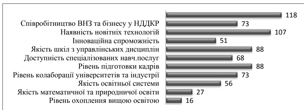
Рис. 2. Місце України за окремими субіндексами індексу глобальної конкурентоспроможності за 2017–2018 рр.