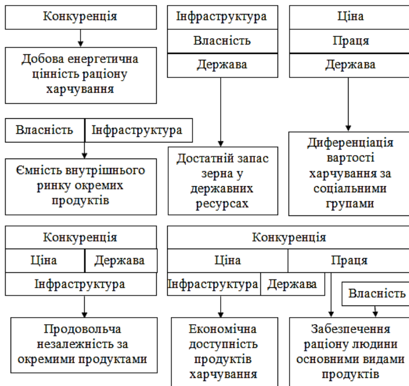
Рис. 1. Взаємозв'язок елементів інституційного середовища та індикаторів продовольчої безпеки [1]

Розглянемо, які саме елементи інституційного забезпечення впливають на продовольчу безпеку у вигляді індикаторів і як вони впливають (рис. 1):