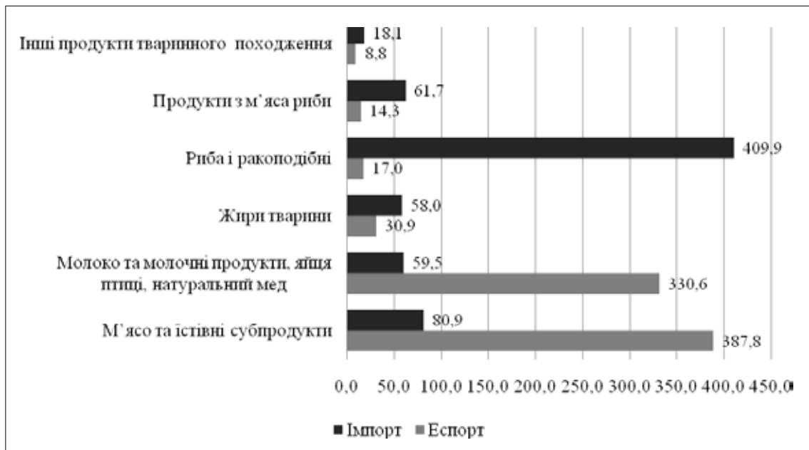
Рис. 2. Структура експорту та імпорту аграрної продукції у 2016 р.

У 2017 р. розпочалося також використання безмитної квоти на молоко, вершки, згущене молоко і йогурти. Крім того, почали здійснюватися поставки молочної сироватки та сирів (до них тарифні квоти не застосовуються).