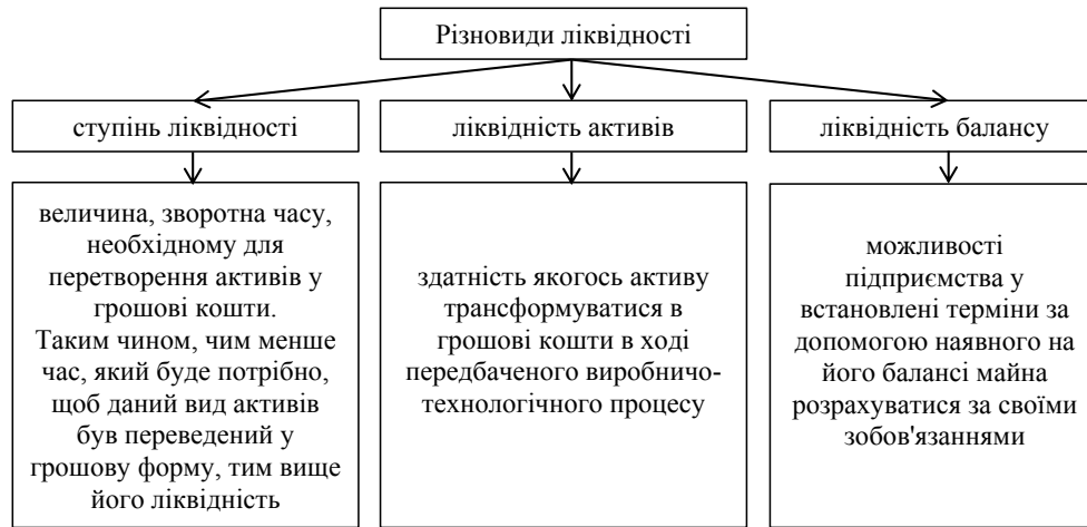
Рис. 1. Різновиди ліквідності

У науковій літературі триває дискусія відносно ототожнення або підміни поняття пла-