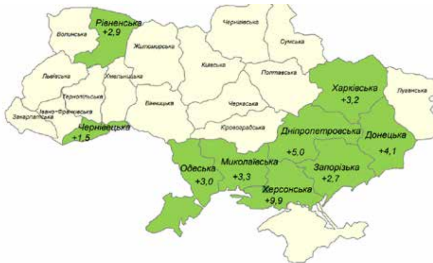
Рис. 2. Топ-9 регіонів України за збільшенням обсягів виробництва продукції сільського господарства [2]