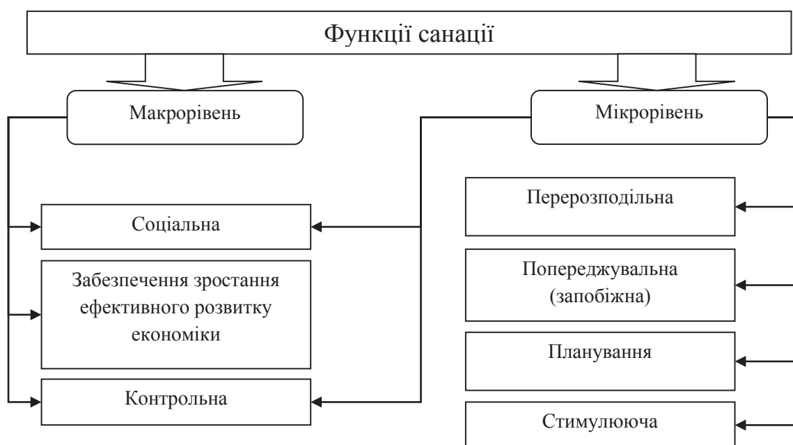
Рис. 3. Функції санації підприємств [8]