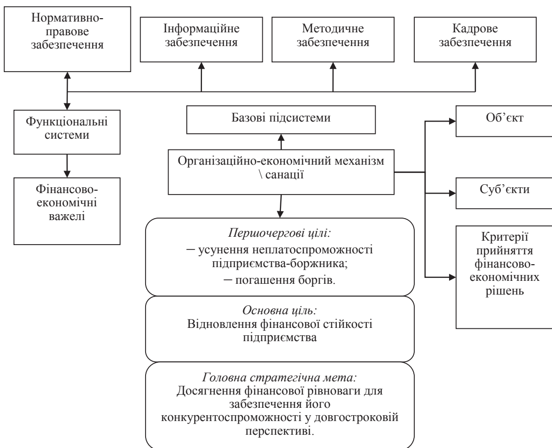
Рис. 1. Структура організаційно-економічного механізму санації [1]

Перерозподільна функція передбачає перерозподіл фінансових ресурсів між суб'єктами санації (підприємством-боржником, кредиторами, власниками, державою (в особі органів