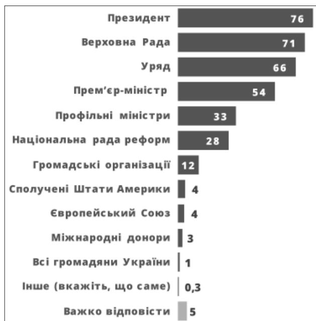
Рис. 1. Відповідальність за прогрес реформ в Україні у 2016 р.,% респондентів

На жаль, тільки 3% опитуваних громадян вважають, що саме вони несуть повну відповідальність за ту соціально-економічну ситуацію, що склалася в країні, і тільки 3,8% респондентів згодні з тим, що саме вони відповідальні за стан речей у їх рідному регіоні, місті, районі. Іншими словами, більшість населення не вважає за потрібне брати активну участь у процесах трансформації суспільства та системи соціально-економічних взаємовідносин і живе за принципом «Моя справа маленька».