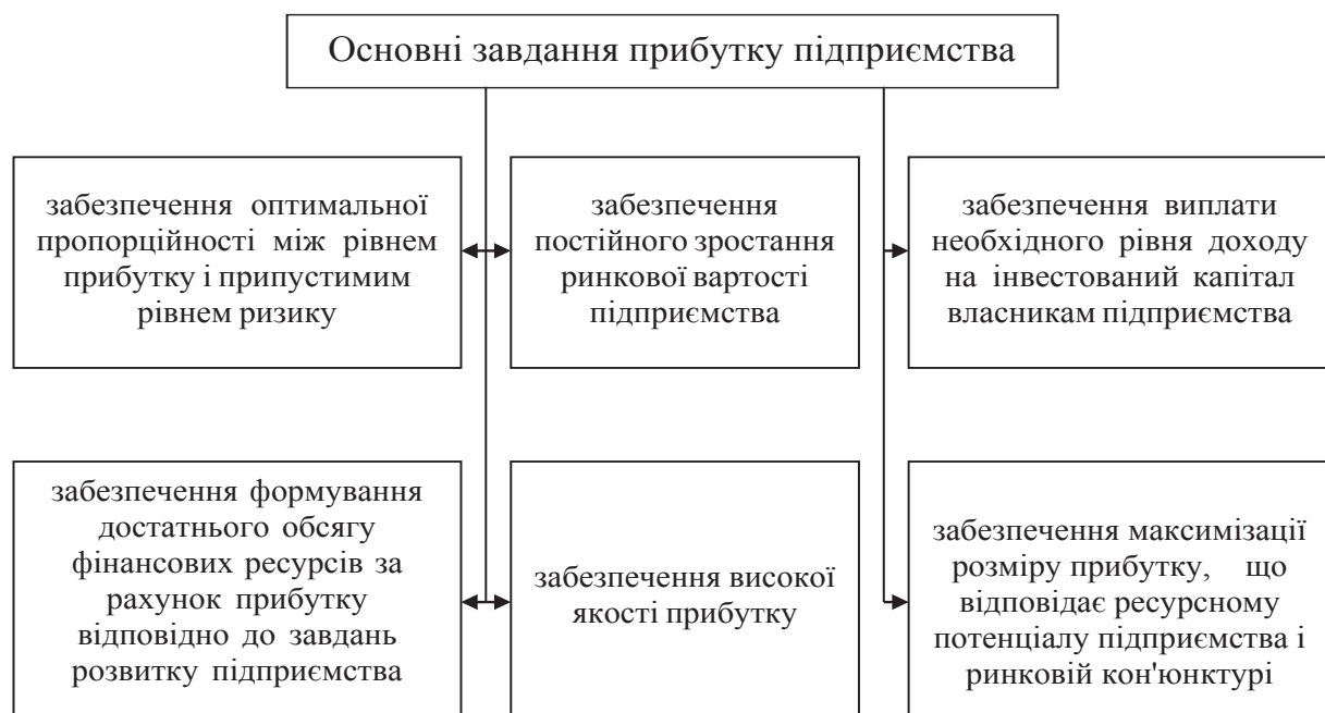
Рис. 2. Основні завдання прибутку підприємства