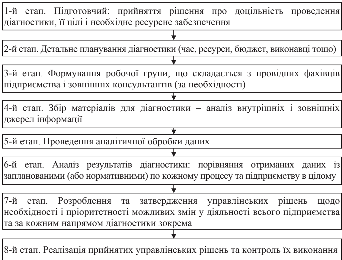
Рис. 2. Етапи діагностичного аналізу бізнес-процесів підприємства