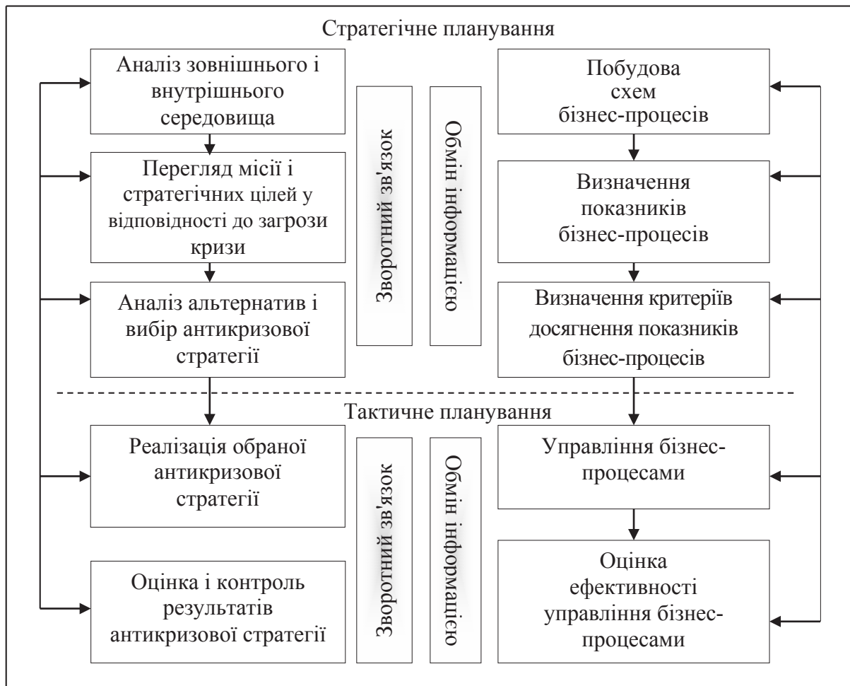
Рис. 4. Взаємозв'язок антикризового і процесного управління [9]

Основна мета п'ятого етапу – визначення економічного ефекту від упровадження запропонованих заходів за кожним бізнес-процесом і розрахунок інтегрального ефекту. Під