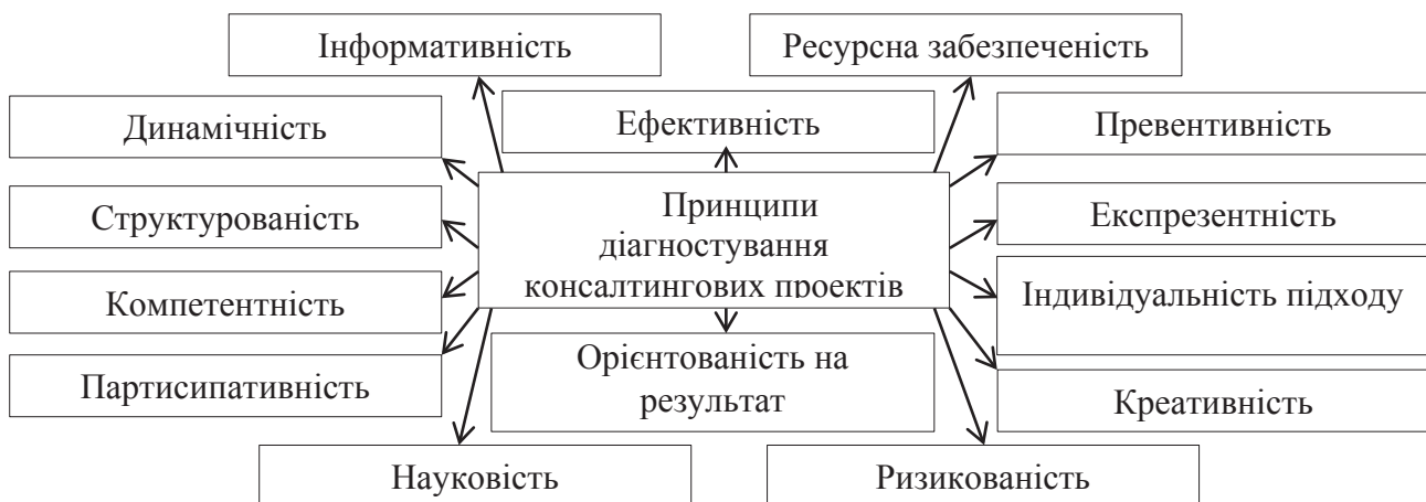
Рис. 1. Принципи діагностування консалтингових проектів для підприємств

Основними цілями суб'єктів є діагностування конкурентоспроможності; асортименту продукції; діючої стратегії; фінансових результатів; кваліфікації кадрового складу; інвестиційної привабливості; інформаційної бази; технології створення та реалізації кожного