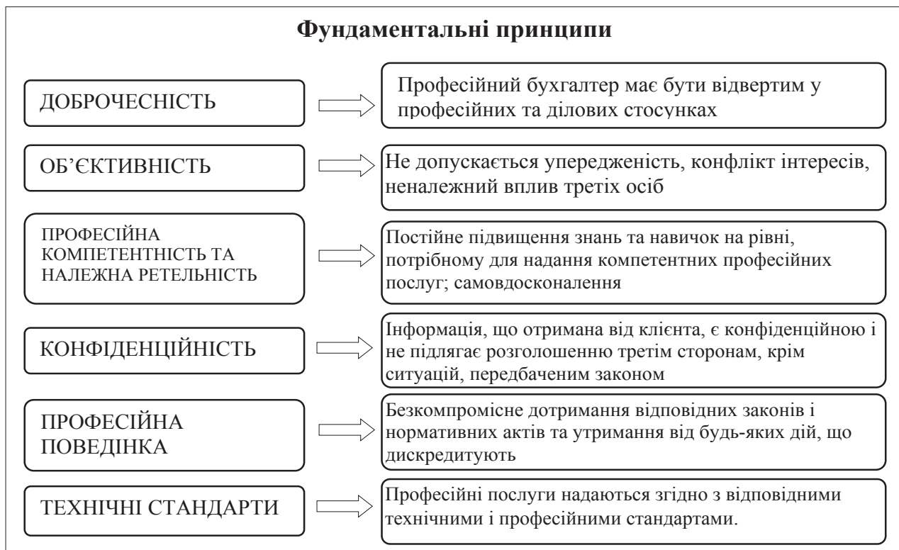
Рис. 2. Фундаментальні принципи професійної етики бухгалтерів

У результаті інтеграції система обліку буде забезпечувати ефективний процес виявлення, вимірювання, накопичення, аналізу, підготовки, інтерпретації та подання інформації для зовнішніх користувачів, зокрема акціонерів, кредиторів, регулюючих і податкових органів, а також використання керівництвом для ефективного планування, оцінки та управління в організації й оптимального витрачання ресурсів.