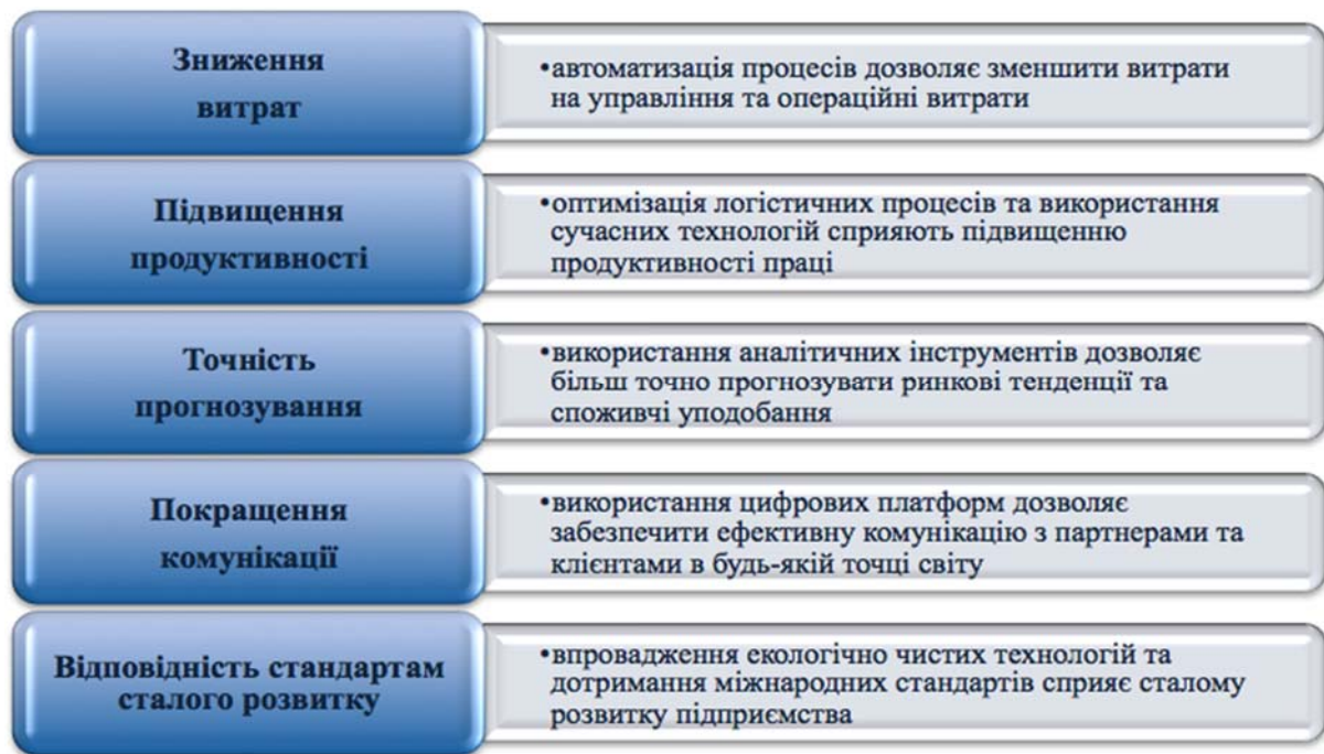
Рис. 2. Переваги застосування інформаційно-інноваційних підходів у зовнішньоторговельній діяльності підприємств