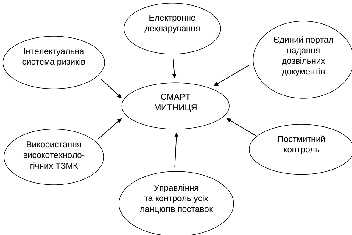
Рис. 1. Основні принципи функціонування Смарт митниці

Вдосконалення митної політики України відповідно до векторів, зазначених на рис. 2, дасть можливість зменшити кількість злочинів та правопорушень, здійснюваних в митній сфері, покращити роботу митних органів та активізувати роботу щодо захисту та охоро-