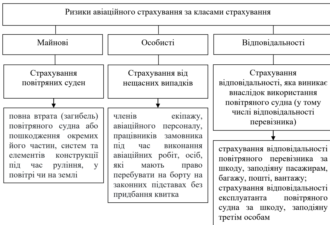
Рис. 1. Ризики авіаційного страхування за класами

ФІНАНСИ, БАНКІВСЬКА СПРАВА ТА СТРАХУВАННЯ